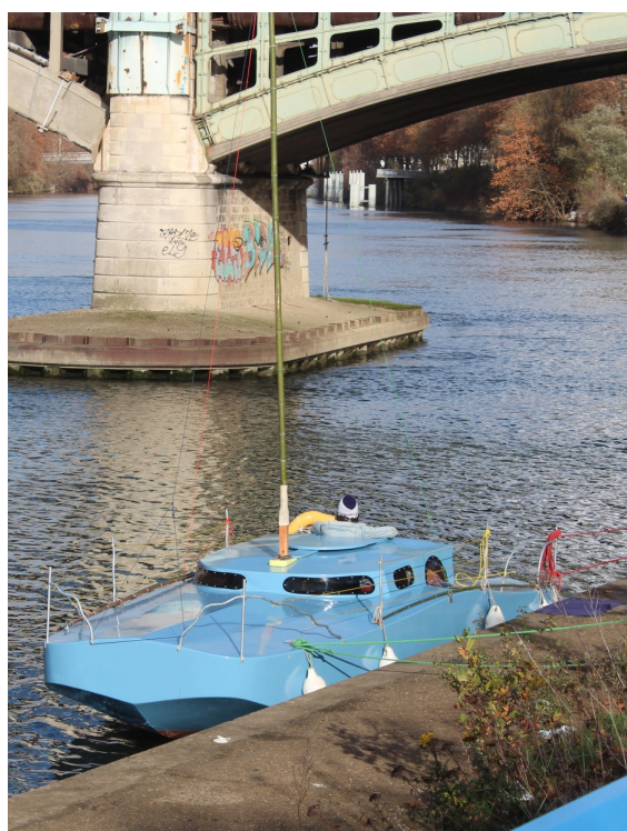
Joachim Monvoisin, Ingénue , 2025 Projet lauréat 2025 du Fonds de production artistique Enowe-Artagon – © Joachim Monvoisin