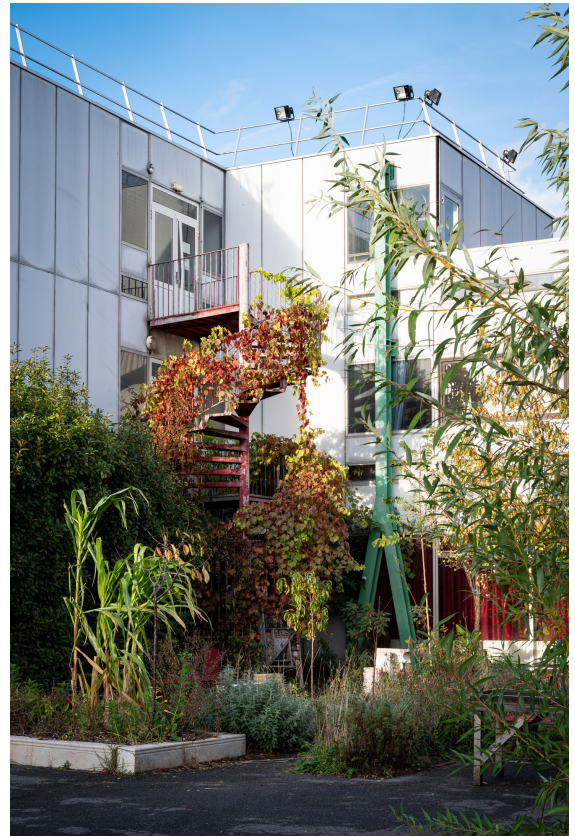
Vue d'Artagon Pantin – Photo © Julien Bramy - © Artagon

La certification qualité a été délivrée au titre de la catégorie d'action suivante : actions de formation