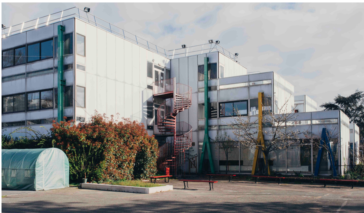
Vue d'Artagon Pantin – Photo © Laura Lafon - © Artagon

→ Artagon ne sera pas en mesure de fournir le matériel informatique et les licences d'utilisation.