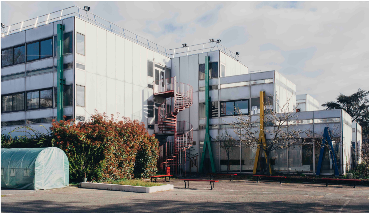
Vue d'Artagon Pantin

La formation est pensée pour favoriser l'autonomie, la clarté d'organisation et la capacité à valoriser un projet auprès de partenaires, de financeurs ou de publics. Chaque étape fait l'objet d'exercices pratiques, de mises en situation et de retours personnalisés, afin de permettre à chacun-e de consolider ses acquis et de repartir avec des outils et des documents immédiatement mobilisables dans différents contextes.